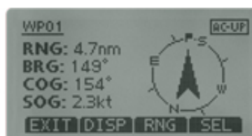
Navigation to a waypoint